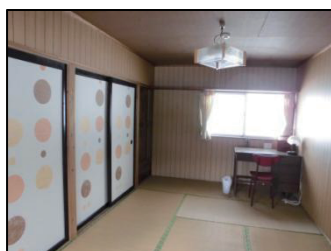
2 人用部屋 （小豆）