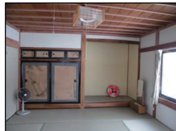
3 人用部屋 （大豆）