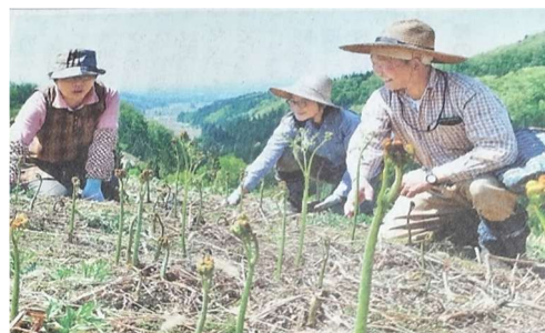
■裏面にワラビ園案内図